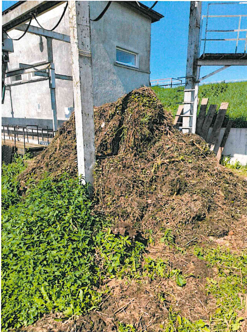
Vecbērzes poldera sūkņu stacijas sanešu laukums