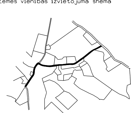
Zemes vienības izvietojuma shēma

par zemes vienības platību un izvietojumu apvidū