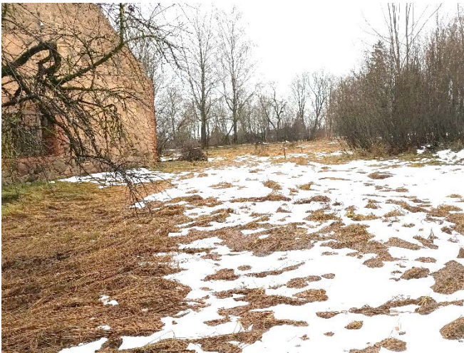
Skats uz teritoriju