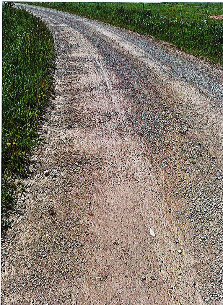
Attēls Nr.1 Jersikas pagasta autoceļa J13 maršruta "Āriņi - Dimanti" Ceļa izskalojumi