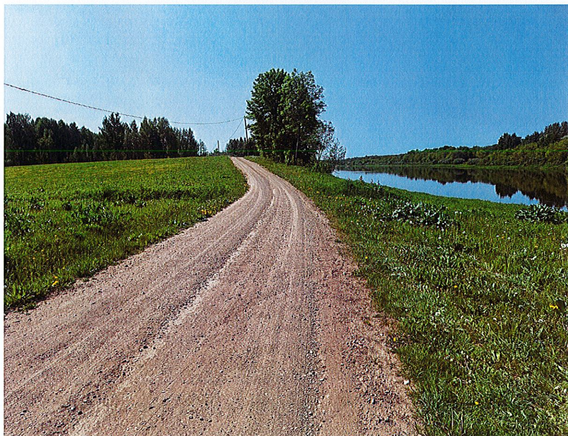
Attēls Nr.4 Jersikas pagasta Skolas ielas (Kad. Nr. 76520050527)

Līvānu novada pašvaldības administrācijas būvniecības nodaļas vadītāja vietniece