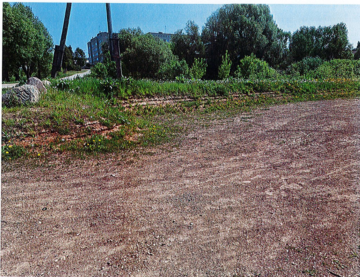
Attēls Nr.12 laivu nolaišanas vietas (Kad. Nr. 76110052224)

Līvānu novada pašvaldības administrācijas būvīnženiere