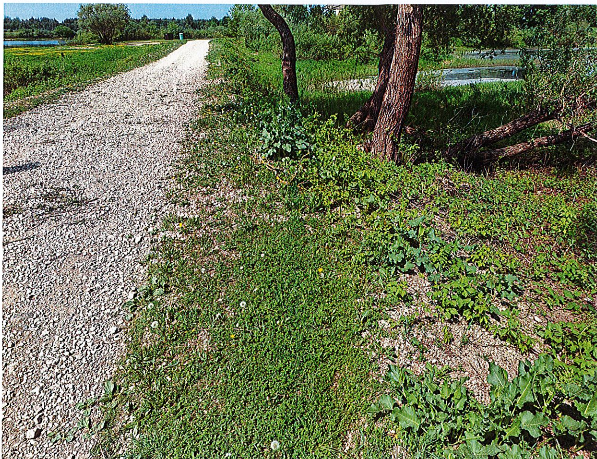
Attēls Nr.7 Baznīcas ielas (Kad. Nr. 76110051017)

Līvānu novada pašvaldības administrācijas būvīnženiere