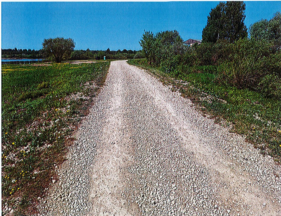
Attēls Nr.10 Baznīcas ielas (Kad. Nr. 76110051017)