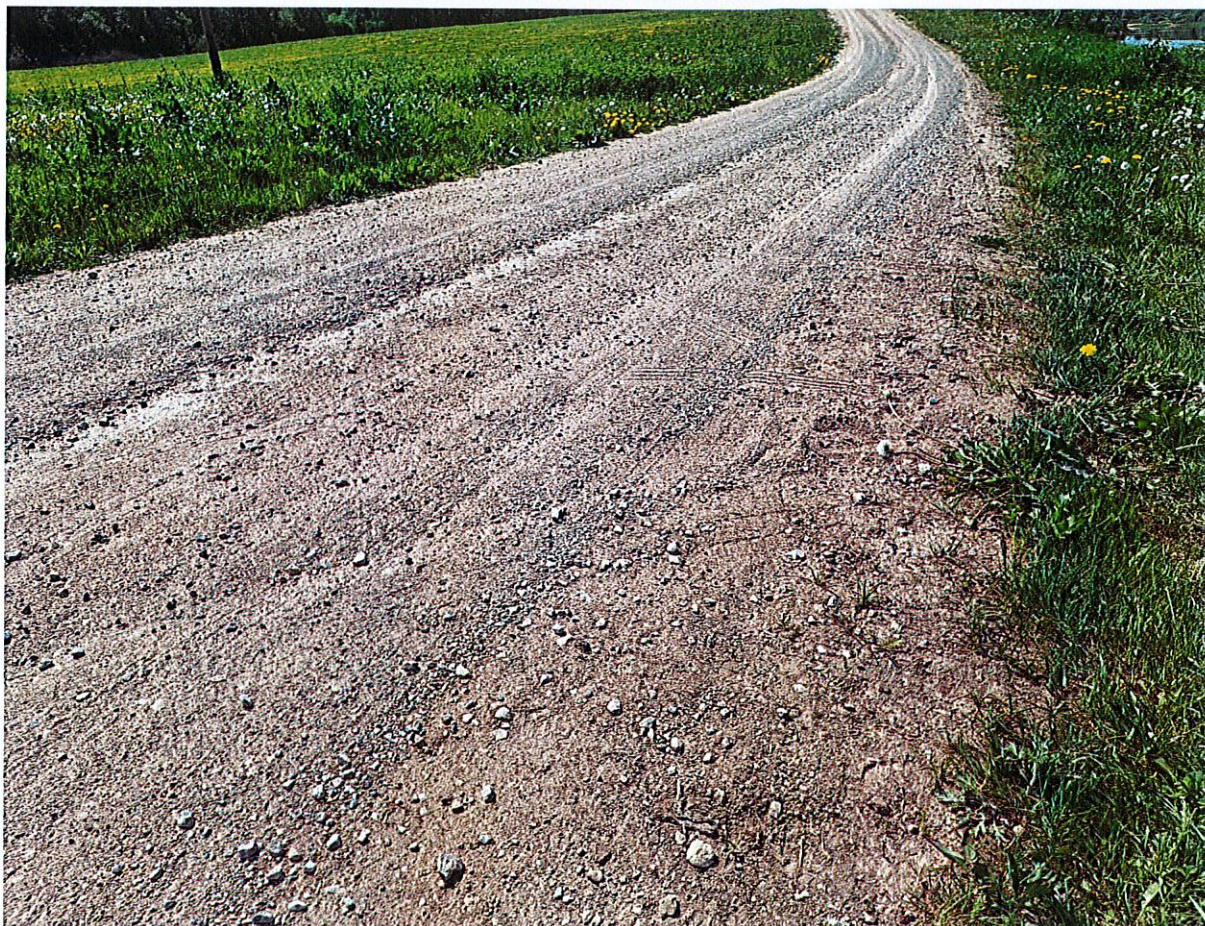
Attēls Nr.5 Jersikas pagasta Skolas ielas (Kad. Nr. 76520050527)

Līvānu novada pašvaldības administrācijas būvzinziene