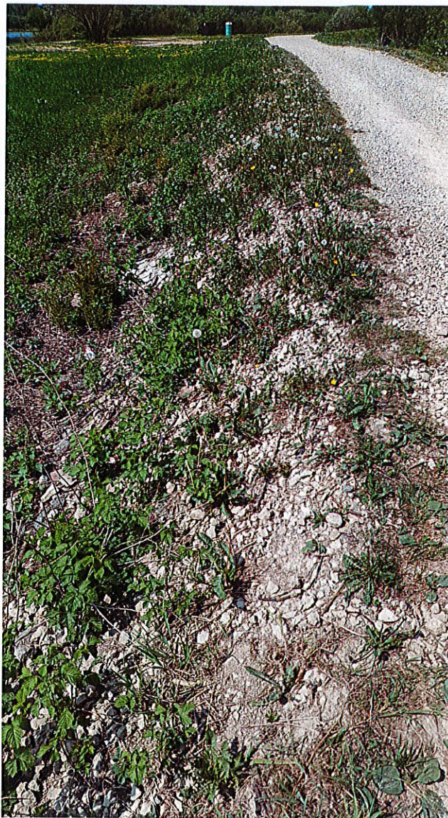
Attēls Nr.9 Baznīcas ielas (Kad. Nr. 76110051017)