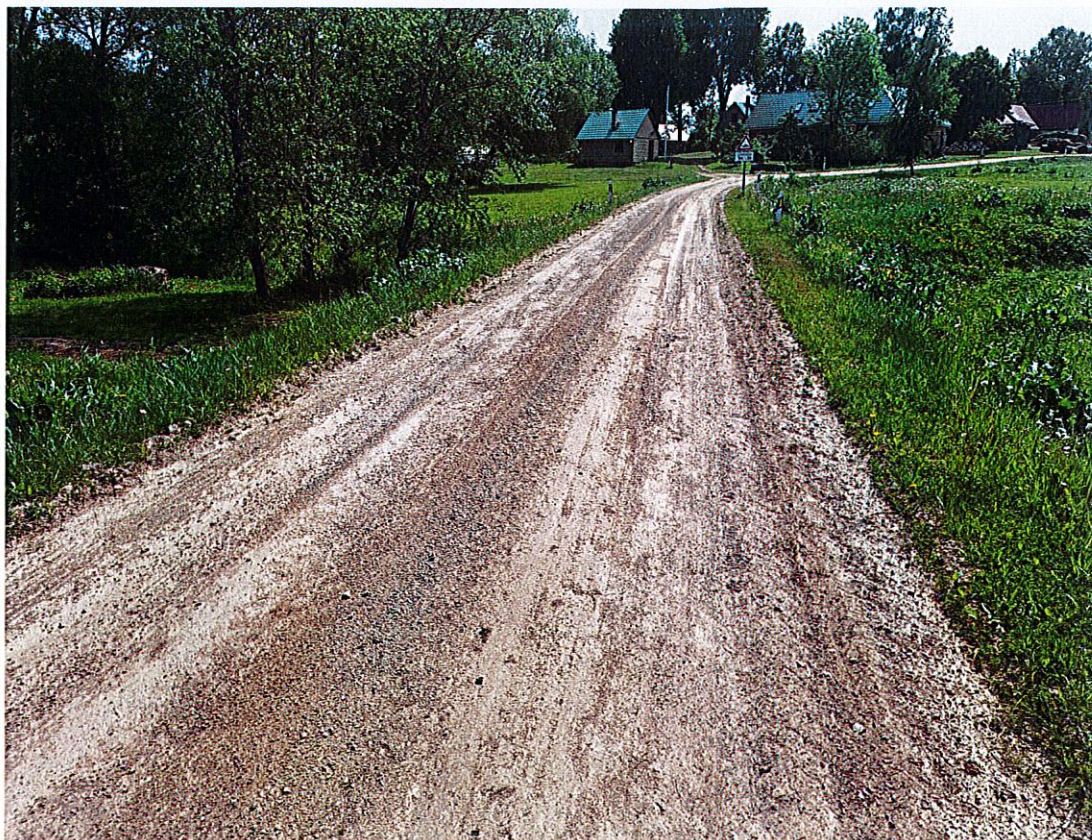
Attēls Nr.3 Jersikas pagasta autoceļa J13 maršruta “Āriņi - Dimanti” Ceļa izskalojumi