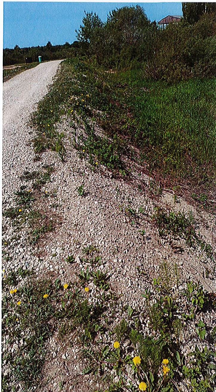
Attēls Nr.8 Baznīcas ielas (Kad. Nr. 76110051017)

Līvānu novada pašvaldības administrācijas būvzinieciene