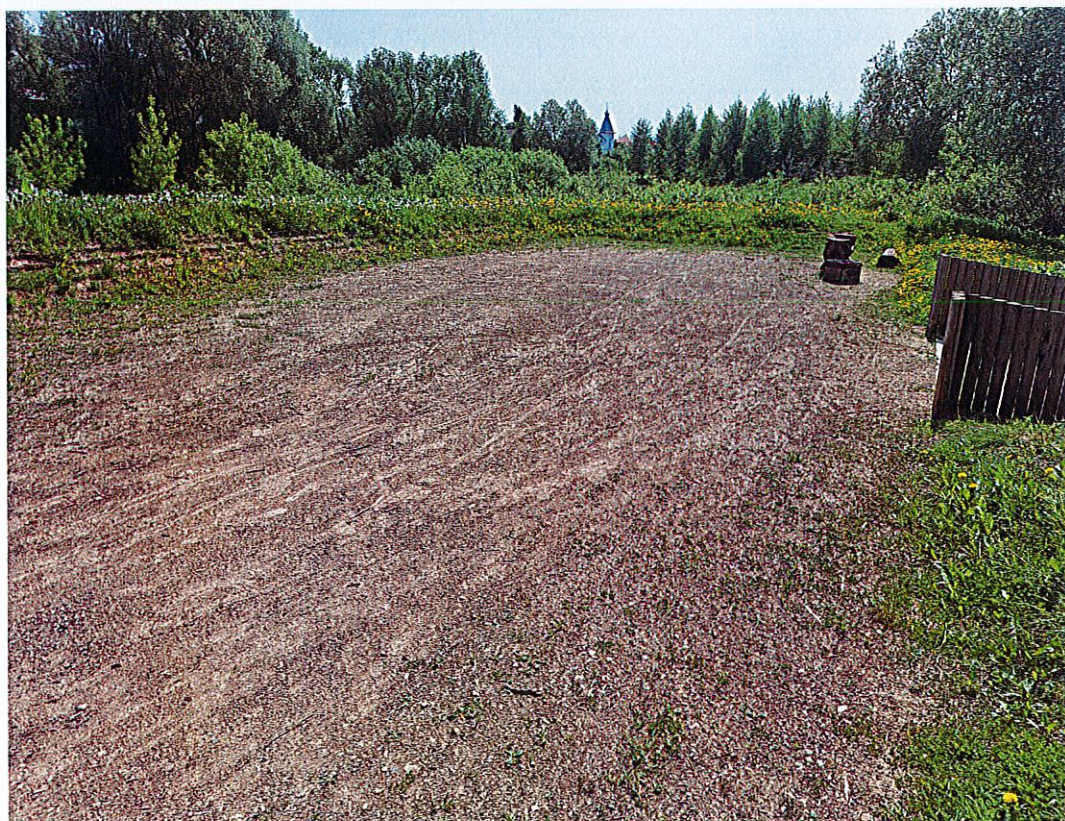
Attēls Nr.11 laivu nolaišanas vietas (Kad. Nr. 76110052224)