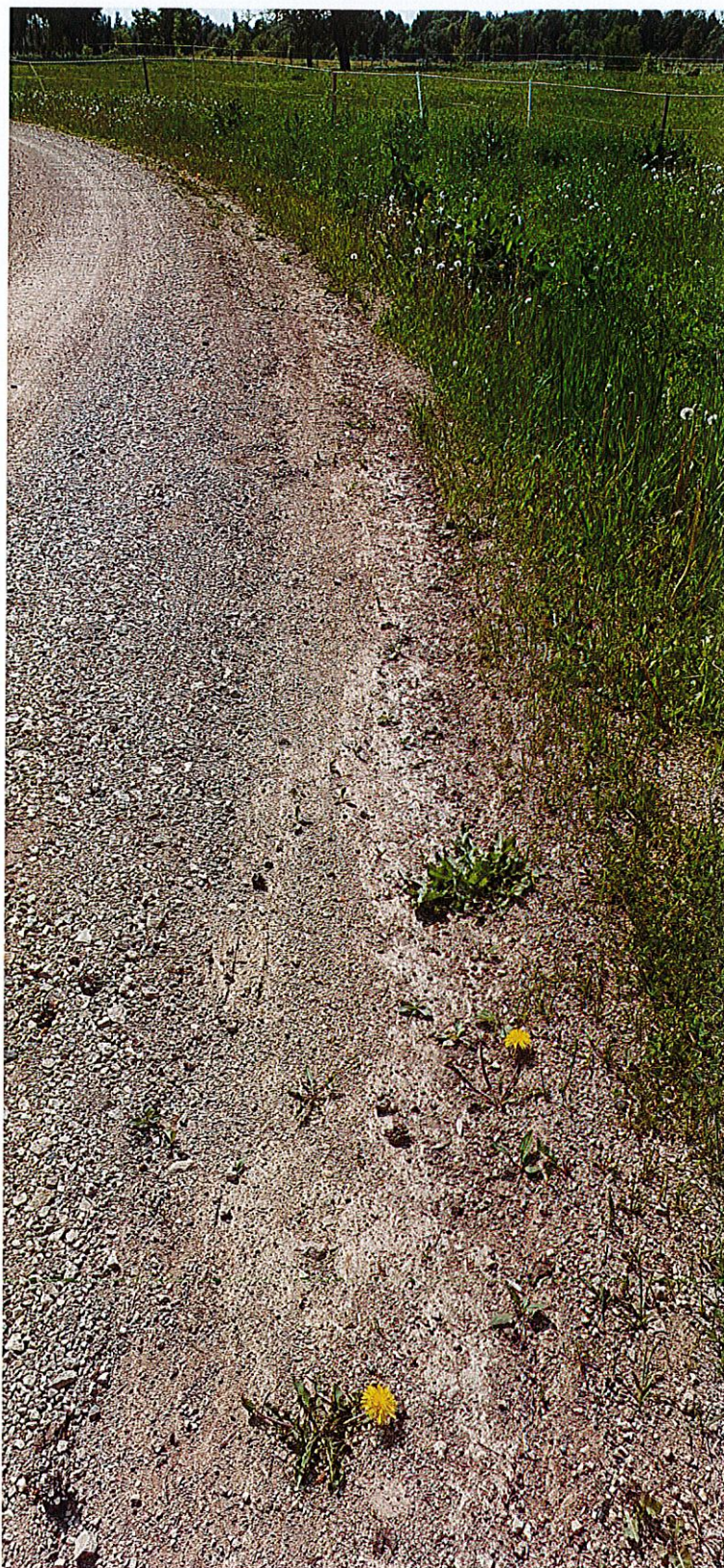
Attēls Nr.2 Jersikas pagasta autoceļa J13 maršruta “Āriņi - Dimanti” Ceļa izskalojumi

Līvānu novada pašvaldības administrācijas būvzinženiere