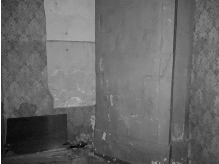
Būve – kūts (būves kadastra apzīmējums 5064 010 0098 006)