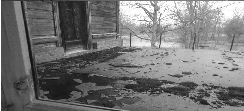
Vieta, kur ēkā ieplūst lietus ūdens.