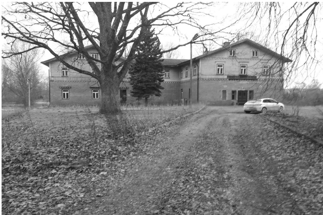
Galvenā fasāde, skats no iebraucamā ceļa puses