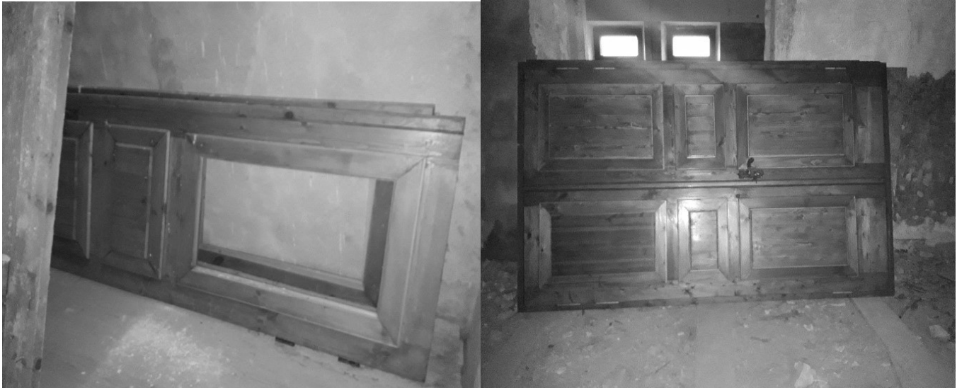
Daļēji atjaunotas ozolkoka durvis