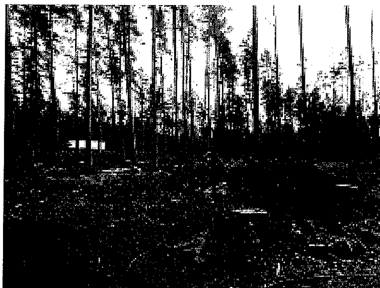
1 - Copy.jpg 6703K