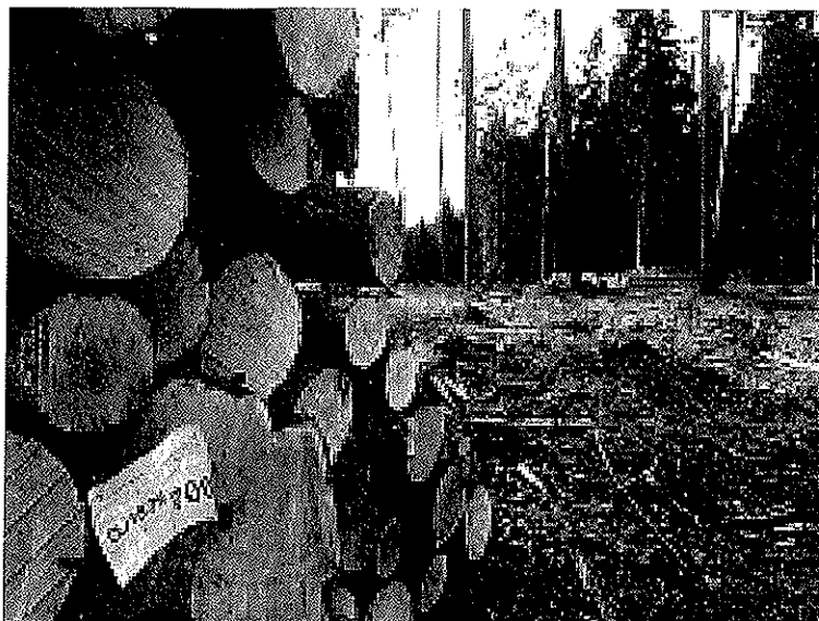
2 - Copy.jpg 5953K